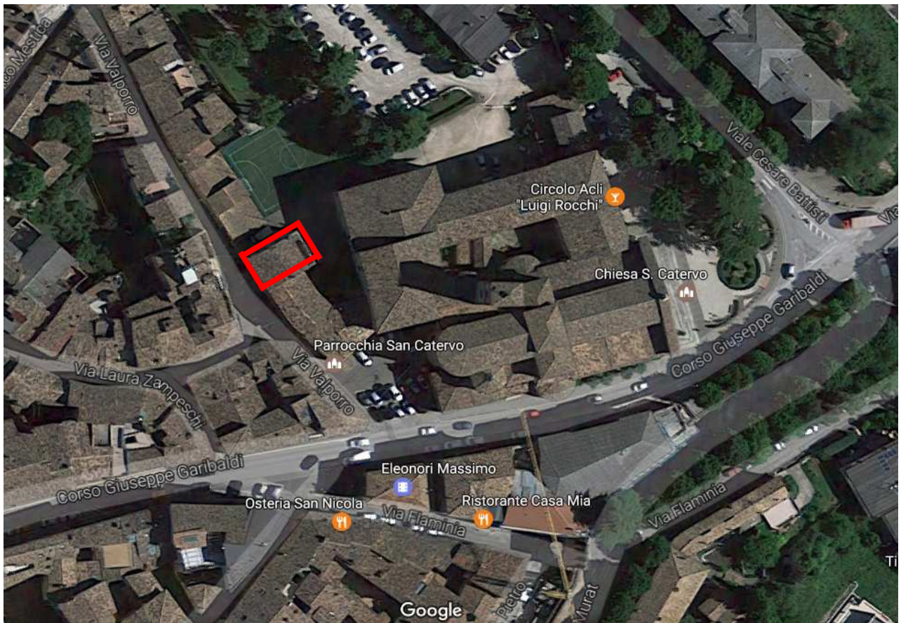
Veduta aerea dell'area